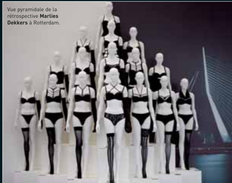
Vue pyramidale de la rétrospective Marlies Dekkers à Rotterdam.

Cette année anniversaire de la marque Undressed by Marlies Dekkers se déroule à 100 à l'heure: depuis le lancement des festivités en janvier, six mois ont passé conclus sur une tournée Saint Valentin, l'ouverture de deux nouvelles boutiques (l'une à Berlin et l'autre à La Haye), la présentation de trois collections PE 2008 et une grande exposition rétrospective au Kunsthal de Rotterdam. Pour les six mois à venir, notons notamment sa participation à la Paris Fashion Week pour y défilier et le lancement de sa première ligne de lingerie de Maternité dans la collection Undressed . Les fêtes de fin d'année ouvriront-elles sur une année de repos bien mérité?