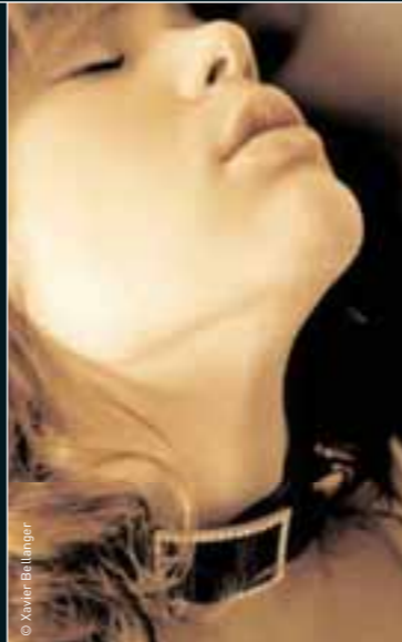
Port de tête troublant en Lolita Pompadour

Récompensée maintes fois pour sa créativité, la marque Lolita Pompadour a aujourd'hui 10 ans. Son site ( www.lolitaompadour.com ) a l'aura mystérieuse et glamour de ses collections. Ses inspirations naviguent entre mode et lingerie. A sa première participation au Spicy Garden du Salon International de la Lingerie, la créatrice voulait justement offrir à ses collections Curiosa et Madame le lieu le plus adapté pour se montrer. L'une raconte une femme sexy et audacieuse en lingerie strassée et teintée d'érotisme. L'autre, plus glamour, adopte cuir et strass, notamment le collier comme un corset lacé, un grand succès de la créatrice qui le renouvelle à l'infini. Du haut de gamme qui a déjà eu l'honneur de plaire à des boutiques comme celles de Chantal Thomass à Paris et Moscou ou celle du Crazy Horse à Paris.